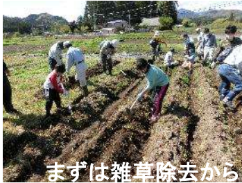
まずは雑草除去から

はじめて親子で里山体験を開催しました。今年は試行のためあまり声をかけませんでしたが、6家族に参加いただきました。まずは遊休農地の雑草除去です。そして肥料等を散布し、じゃがいもを定植しました。さて、これから雑草との戦いです。次にしいたけのコマ入れ体験をしました。子供たちものすごい真剣に作業してくれました。のびのび過ごす子供たちを見て、今後も頑張ろうと思いました。