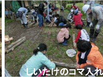
しいたけのコマ入れ