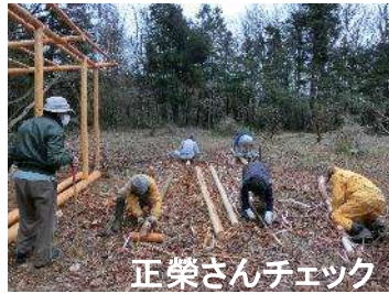
正栄さんチェック