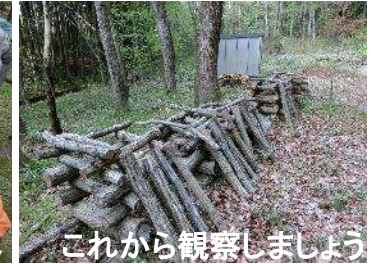
これから観察しましょう