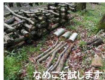
なめこを試みます